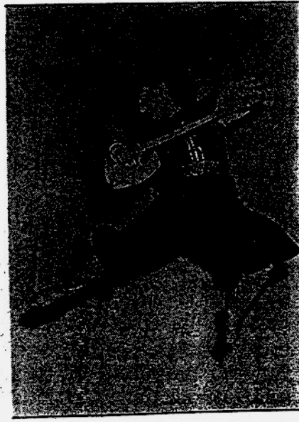
یک صحنه از باالت رقص با همشیره

حالا که استاد جهان‌بازبان را تنیم بی‌مناسب بست از یک بانوی مندم که در این راه رحمت فراوان به دیدن کنیم (مادام بلنا) مستقیما مرا بسان